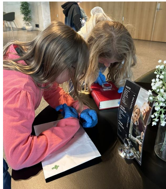
Tårnagenthelg for 3. trinn.