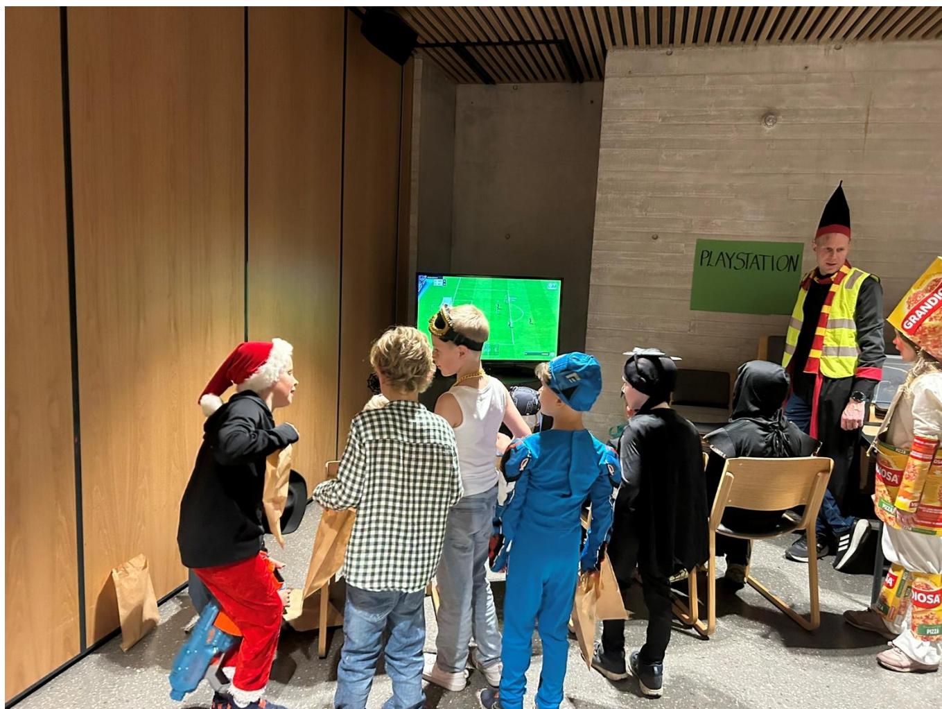
Hallo venn.