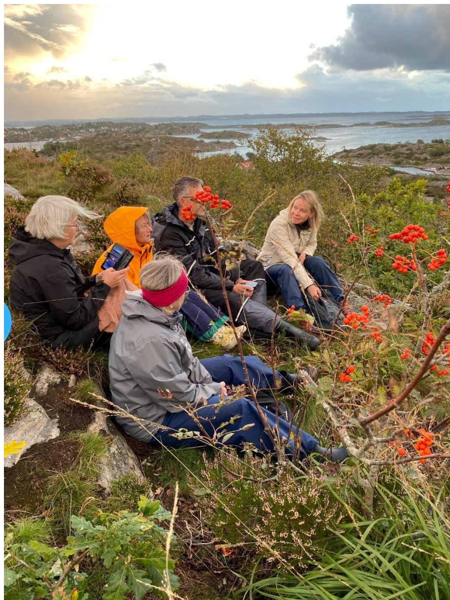
Stemningsbilder fra Katedral Stangefjell.