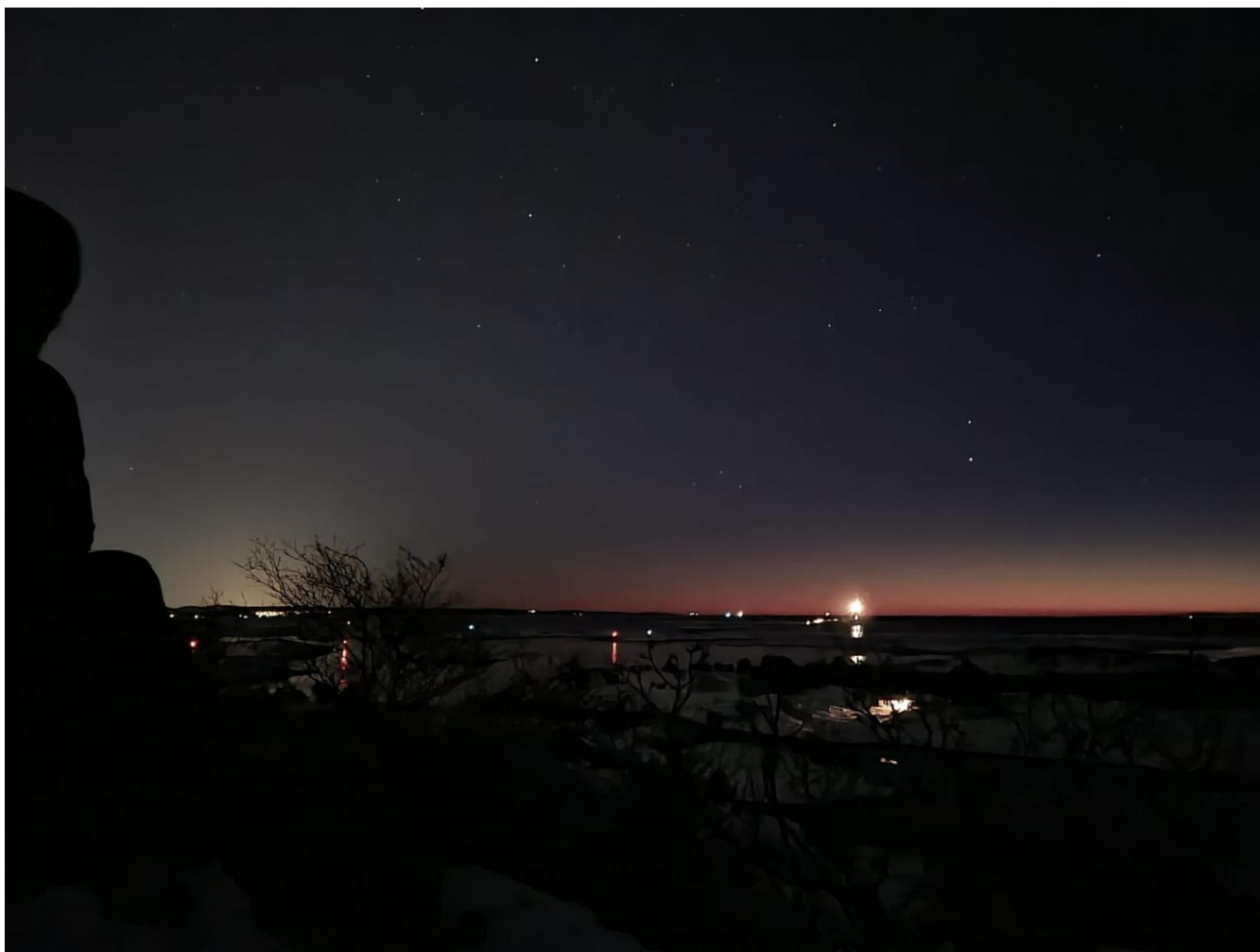
Stemningsbilder fra Katedral Stangefjell.