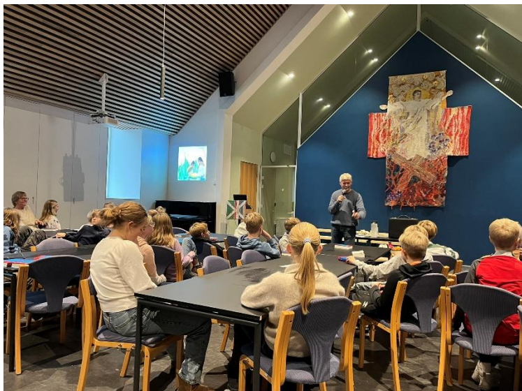
Bibelkurs for 5. trinn