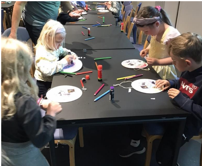
4 års samling.