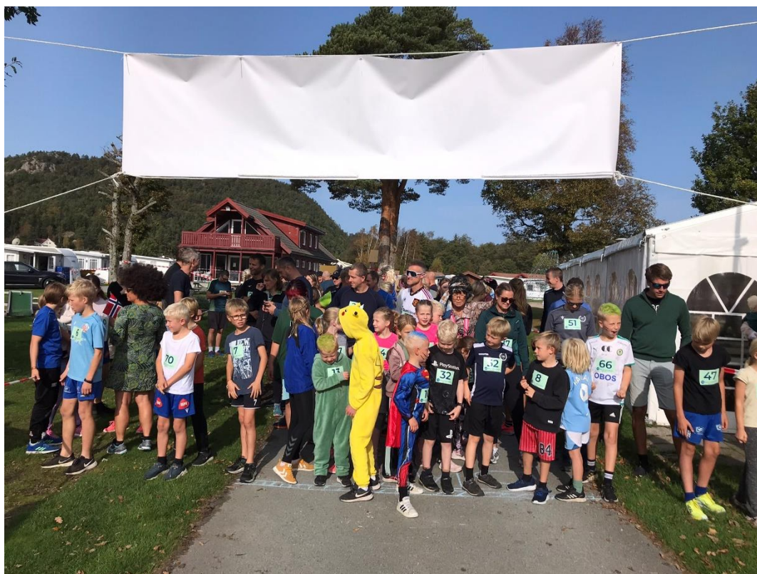
Bilde: Menighetsturen til Solstrand i 2023.