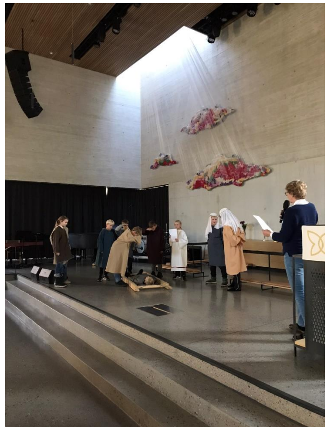
Bibelkurs for 5. trinn