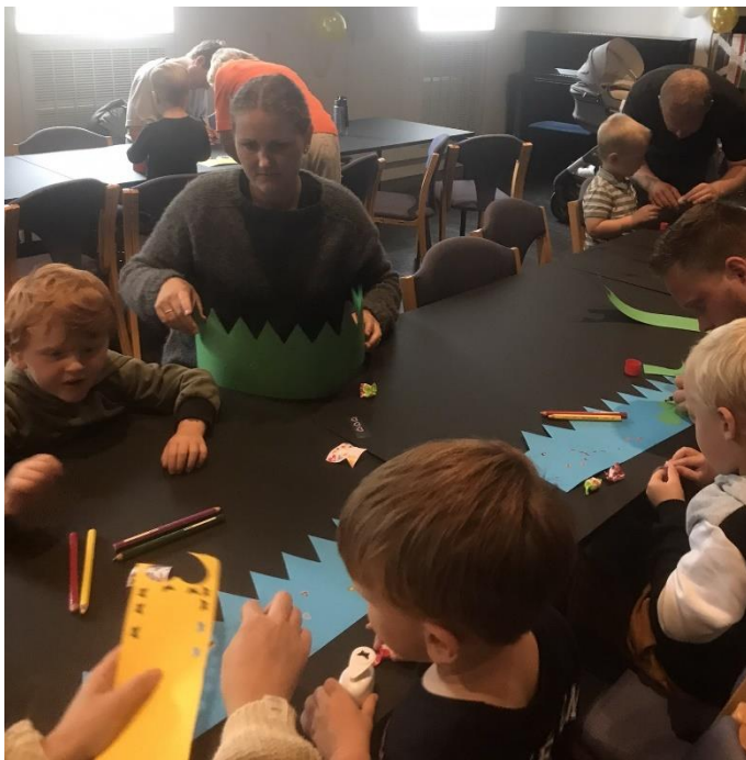
Pinsefest for 1. trinn