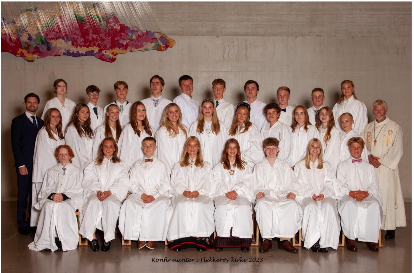
Konfirmanter i Flekkerøy kirke 2023