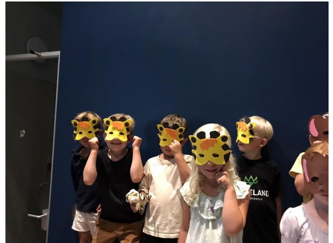
Jungelfest for 5 åringer.